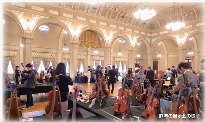
昨年の展示会の様子

あなたの楽器と弓を持ちこみ、展示楽器と弾き比べることも可能です。会場での即売は致しませんが、全ての展示楽器は商品であり、購入可能です。(お持込の際は受付で確認させていただきます)