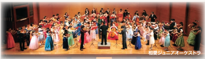
相愛ジュニアオーケストラ

1956年に創設。サイトウ・キネン・オーケストラにその名をとどめる名教育者、故齋藤秀雄教授の薫陶を受け、現在もその独自の指導法を継承している。小学生から高校生による弦楽器を主体とし、毎年秋にはザ・シンフォニーホールにて、春には相愛学園本町学舎にて演奏会を開催。これまで「相愛ジュニアオーケストラヨーロッパ演奏旅行」を3度にわたり敢行。2015年7月にはイタリア演奏旅行を行い、好評を博した。